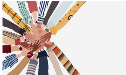
Bild 4 att visa eleverna. Finns som PDF för att skriva ut eller visa på skärm/tavlan.