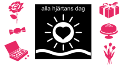
Bild 1 att visa eleverna. Finns som PDF för att skriva ut eller visa på skärm/tavlan.

Under medeltiden började firandet ta form i Storbritannien och Frankrike. I USA började det redan under 1800-talet att bli vanligt att skicka utsmyckade Valentinkort och sedan har det trappats upp. Idag säljs mängder med blommor och presenter inför alla hjärtans dag.