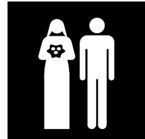
Bild 2 att visa eleverna. Finns som PDF för att skriva ut eller visa på skärm/tavlan.

Enligt den legenden hade den romerske kejsaren Claudius II förbjudit äktenskap för han ville ha ogifta män i sina arméer. Den kristne predikanten Valentin hamnade i fängelse efter att ha vigt par i hemlighet. I fängelset lärde Valentin känna sin fångvaktares dotter och han skrev brev till henne och undertecknade breven "din Valentin". Det kan tänkas vara ursprunget till Valentinkorten. Alla hjärtans dag heter ju också Valentine's Day på engelska. Den 14 februari sägs vara den dag Sankt Valentin avrättades.