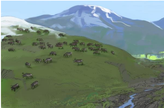
Renar betar på fjällsluttning.

Under vårvintern börjar renarnas horn växa ut igen. Där hornen kommer fram kan det vara lite ömt och det kan göra ont när renen stängas med dem. Renarna börjar också vara redo att vandra vidare från vinterbetet. När renskötarna tycker att det är dags driver de renhjorden långsamt framåt mot fjällsluttningarna där bete har börjat komma fram. Renarna drivs långsamt eftersom många renar kan vara svaga efter vinterbetet och vajorna bär på nya kalvar. När kalvarna föds är det starten på nästa renskötselår.