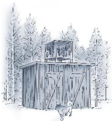
Torka kött i bod