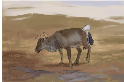
Vaja föder en renkalv