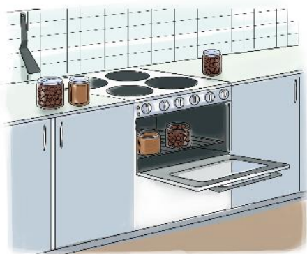
Konservera köttbullar i ugn

Att röka kött gör man genom att först lägga det i salt, antingen i torrsalt eller i saltlake. Sedan röker man köttet i en kåta med en eldstad i mitten, eldstaden kallas årran. Köttet hängs tvärsöver rökhålet i taket och en eld av fuktig björkved tänds under. Röken ger smak till köttet. När köttet är färdigrökt och fått kallna hängs det på torkställningar med myggnät runt på taket till köttboden. Att hänga köttet högt skyddar det från hundar och rävar. Myggnätet skyddar det från insekter. När köttet torkat färdigt läggs de i frysen och torkningen avtar. Får det torka för länge blir köttet hårt och inte gott att äta.